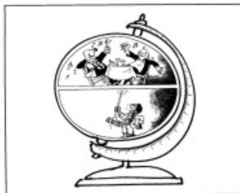
Figura 3 Globo terráqueo escindido

Hay pocas respuestas que hagan referencia a las causas de esa situación o que muestren iniciativa o compromiso por parte de los que responden. Son numerosas las respuestas que se tiñen de lástima o de pena, e incluso de un sentimiento de superioridad.