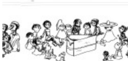
Figura 4. Tarta mundial