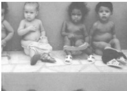
Figura 1. Guardería de niños en Brasil

Así en la primera imagen “la guardería de Brasil” la mayoría de las respuestas pueden dividirse en dos categorías: aquellas que hacen referencia a la igualdad entre los seres humanos, tales como: