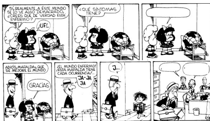
Figura 5. Viñetas de Mafalda (Quino)

Con esta actividad en la que los estudiantes participantes tenían que completar dos tiras de Mafalda pretendíamos averiguar cuáles eran los males del mundo según el encuestado y contrastar estos resultados con los obtenidos en la primera parte de la encuesta. Recordemos que, según el cuestionario, el problema mayor de la humanidad es el medio ambiente y, en segundo lugar, el terrorismo. En la primera de Mafalda surgen esos y otros problemas: