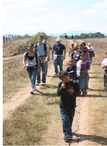
Caminatas en las comunidades

Visitas a lugares turísticos (Panajachel, Antigua Guatemala, Ruinas Mayas, Reservas naturales) contrasta las bellezas naturales y culturales que Guatemala ofrece, con una necesidad rural, sedienta de oportunidades en una realidad del país.