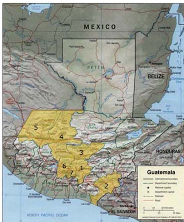
1.- Guatemala 2.- Jutiapa 3.- Baja Verapaz 4.- El Quiché 5.- Huehuetenango 6.- Chimaltenango 7.- Sacatepéquez

En el año 2007, las universidades de Temple y San Diego de los Estados Unidos de América, mostraron alto interés en dar inicio al proyecto TS con SHARE, enviaron a los responsables de su programa universitario para hacer una visita de diagnóstico y reconocimiento del área que el proyecto propone para desarrollar el plan piloto: San Martín Jilotepeque, municipio de Chimaltenango (6).