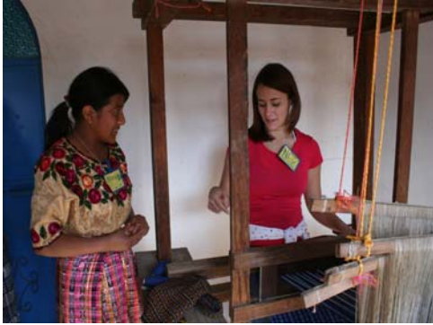
Visitas a grupos de artesanos