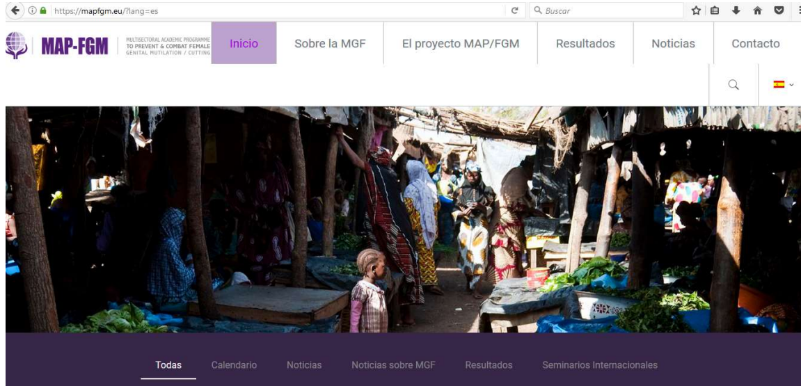
Página web del proyecto en seis idiomas.

Con la pretensión de involucrar a un público más amplio, MAP-FGM diseminará, con carácter periódico, sus resultados a través de su página web y boletines electrónicos trimestrales en seis idiomas.